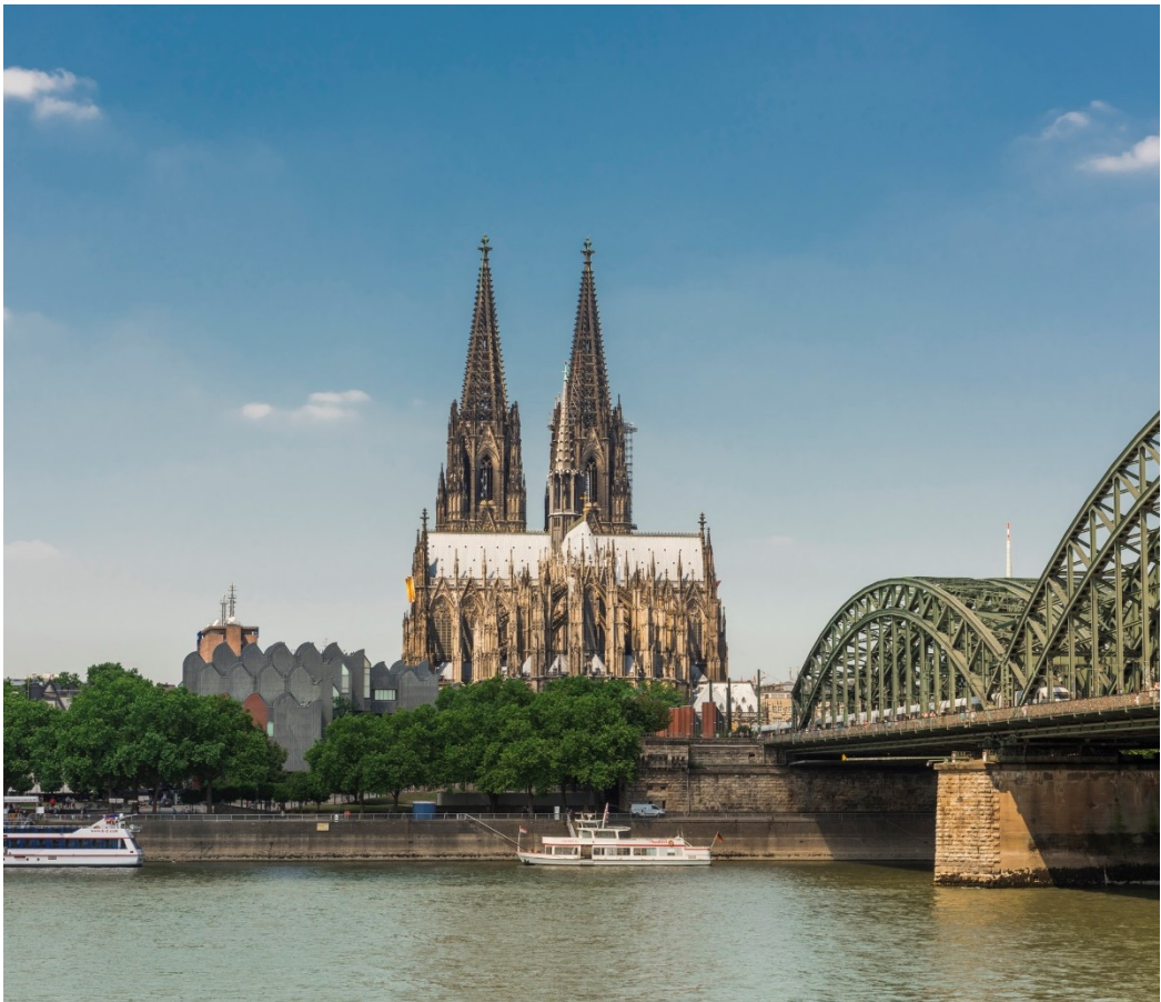
Außenbau, Ansicht von der Deutzer Seite mit Hohenzollernbrücke