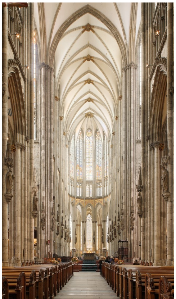
Innenraum, Langhaus, Ansicht nach Osten, Gesamtansicht in den Kölner Dom