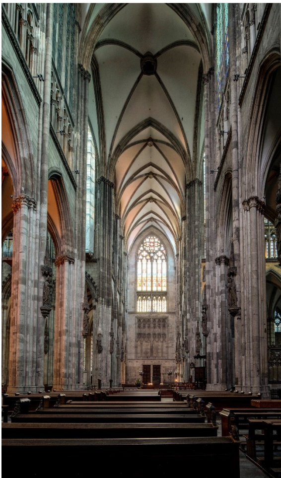
Innenraum, Nordquerhaus, Ansicht nach Norden, Gesamtansicht in den Kölner Dom